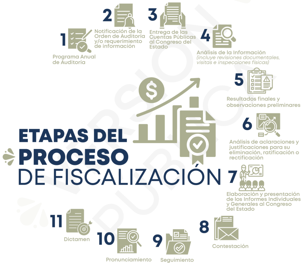
Ilustración 1. Diagrama del proceso de fiscalización superior