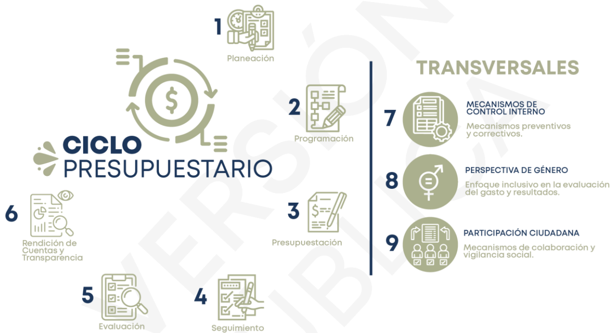
Ilustración 2. Procedimientos generales de la auditoría de desempeño 2024