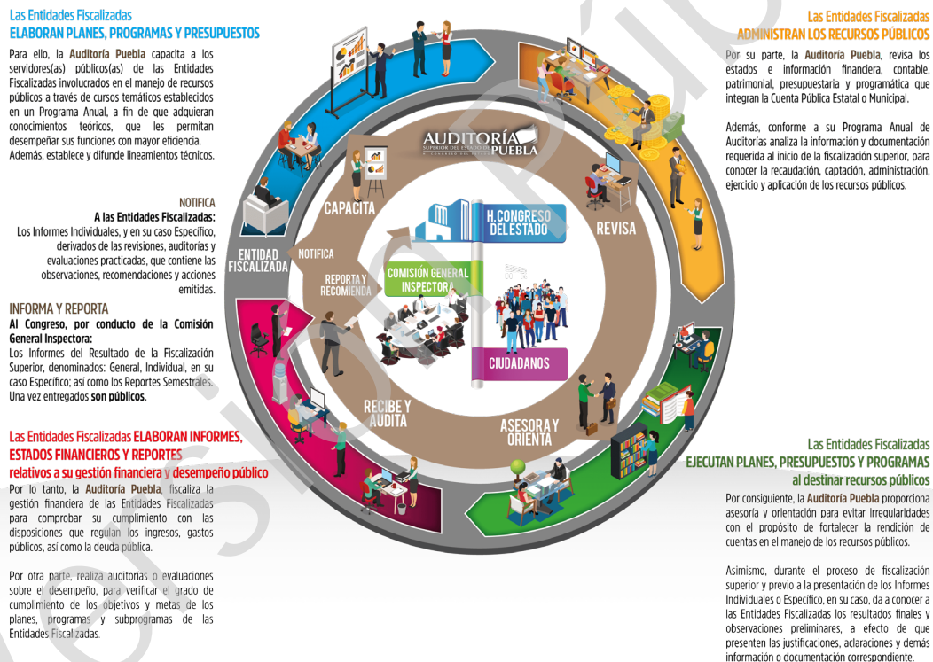
Diagrama 1 Proceso de Fiscalización Superior 2017