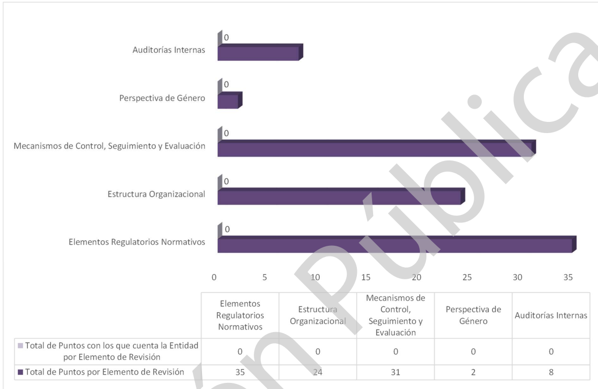
Gráfica 1 Cumplimiento de los Mecanismos de Control Interno Ejercicio 2020